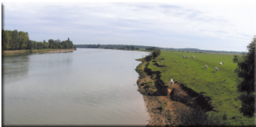
Bord de Saône à Arbigny

Cette espèce, présente sur certaines parcelles, produit un latex toxique pour le bétail et son abondance peut entraîner une baisse de la diversité végétale.