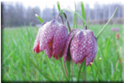
Fritillaire pintade

Le site est également caractérisé par des boisements alluviaux très