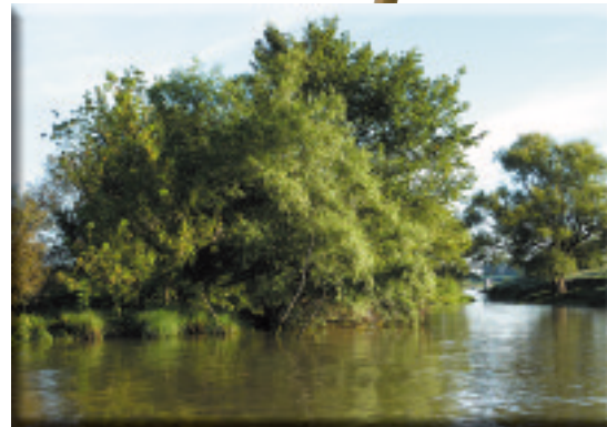
Îlot boisé sur la Saône

Pour toute information complémentaire vous pouvez contacter :