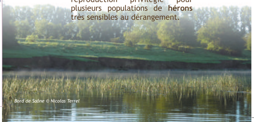
Bord de Saône

La forêt alluviale du bois de Maillance présente des milieux favorables à certaines espèces telles que le Triton crêté ou la Barbastelle . L'île de la Motte représente quant à elle, un site de reproduction privilégié pour plusieurs populations de hérons très sensibles au dérangement.