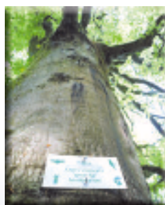
Îlot de sénescence