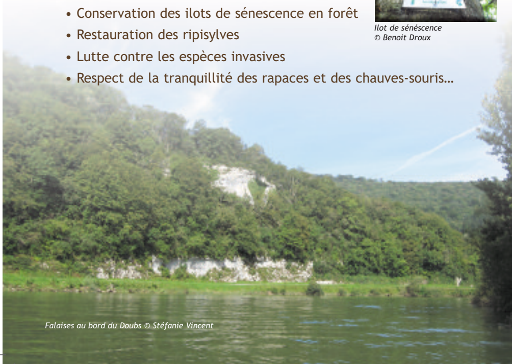
Falaises au bord du Doubs

Pour toute information complémentaire vous pouvez contacter :