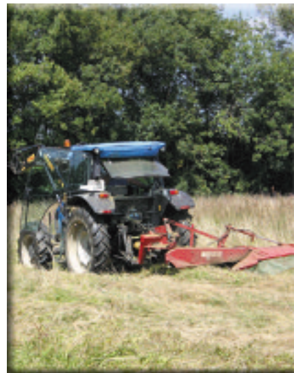
Fauche tardive

Aussi, l'un des objectifs est de sensibiliser l'ensemble des usagers à la fragilité de ces écosystèmes.