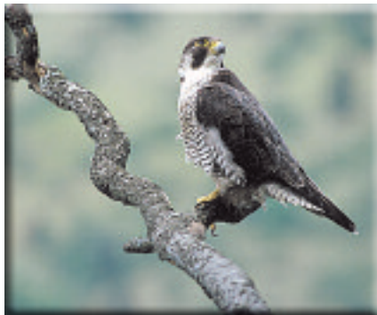
Faucon pèlerin

Les milieux forestiers, majoritaires sur le site, hébergent différents Pics ( Pic cendré , Pic mar , Pic noir ...) et représentent également une zone d'habitats avérés pour le Lynx .