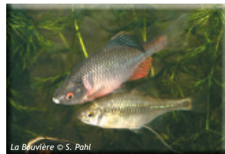
La Bouvière

Forêts de pente - Oiseaux de falaises - Chauve-souris - Zones humides