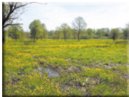
Marais de Saône

Le site de la Moyenne Vallée du Doubs, forestier à plus de 70%, est composé de nombreuses forêts de pente dont le caractère naturel est un facteur favorable pour la biodiversité. Ainsi, un des enjeux de la zone est la gestion durable de ces boisements , basée sur la conciliation de l'exploitation forestière et de la protection du milieu. A l'inverse, les forêts alluviales sont faiblement représentées sur le site. Elles