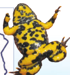
Crapaud sonneur à ventre jaune

Le site accueille enfin cinquante-six espèces animales remarquables dont le Grand Rhinolophe la Rainette verte ou encore le Courlis cendré et le Sonneur à ventre jaune .