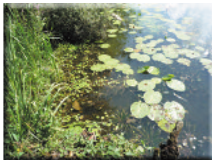
Ananas d'eau et hydrocharis des grenouilles, Chaux-lès-Port

L'enjeu principal sur le Val de Saône Haut-Saônois est la préservation des prairies inondables . Sur ce site, les prairies sont en effet en bon état global de conservation mais celui-ci n'est pas homogène sur l'ensemble de la vallée. Ainsi, la moitié amont du