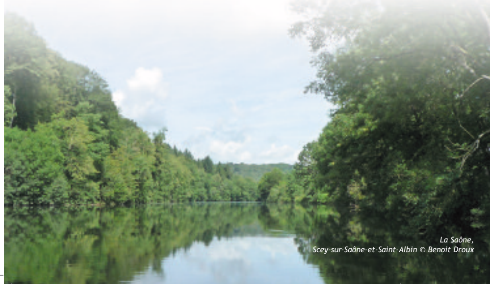
La Saône, Scey-sur-Saône-et-Saint-Albin © Benoit Droux