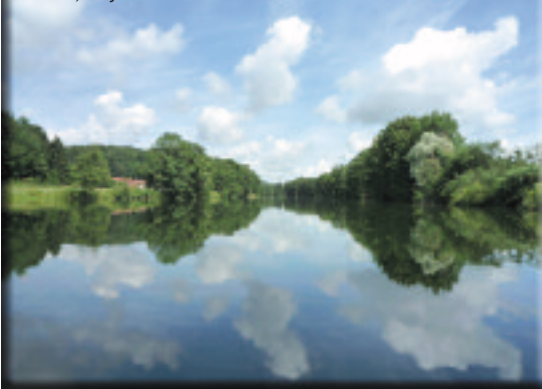
La Saône, Scey-sur-Saône-et-Saint-Albin