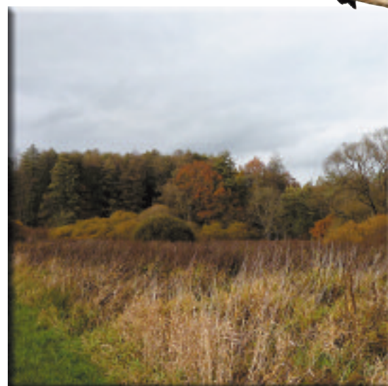
Zone humide à Faverney

Pour toute information complémentaire vous pouvez contacter :