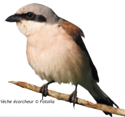
Pie-grièche écorcheur

La préservation des forêts alluviales est également un enjeu important au même titre que celle des zones humides . En effet leur superficie restreinte et leur richesse écologique nécessitent la mise œuvre d'une gestion adaptée.