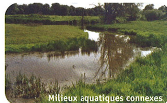
Milieux aquatiques connexes

En dehors des prospections de terrain nécessaires à la validation des données, le document d'objectifs sera réalisé à partir des études, procédures et documents récents existants.