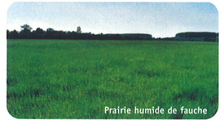
Prairie humide de fauche

Le site Natura 2000 "Vallée de la Saône" concerne 68 communes riveraines de la Saône sur tout le département de la Haute Saône.