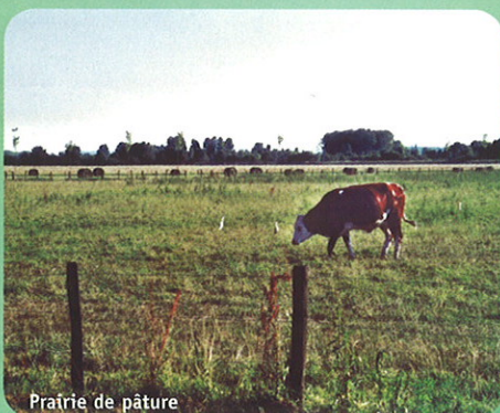
Prairie de pâture