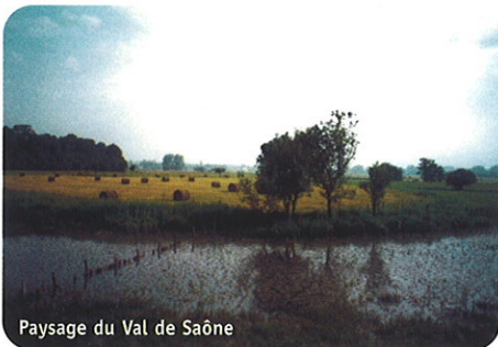
Paysage du Val de Saône

La surface du site est d'environ 13 500 ha entre Jonvelle et Broye-Aubigny-Montseugny.