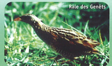
Râle des Genêts